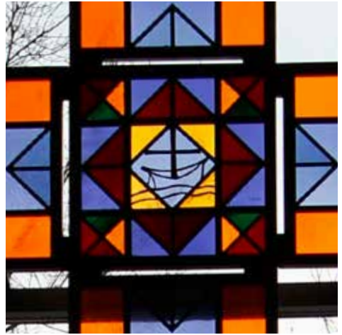
Ausschnitt aus dem Fensterbild der Arche

Heute und hier kommen keine Schiffe und dennoch singen wir dieses Lied voller adventlicher Hoffnung, weil man auch heute und hier in unseren Gesichtern die gleiche Sehnsucht sehen kann.